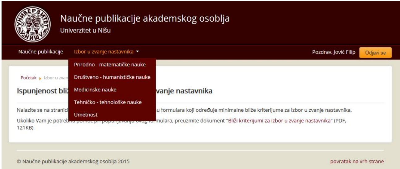
slika 1 - osnovni meni

Alat se nalazi na adresi www.npao.ni.ac.rs i pristup alatu imaju svi registrovani korisnici ovog portala. U horizontalnom meniju na vrhu se, nakon logovanja na sistem, pojavljuju opcije koje korisnika vode najpre do odgovarajućeg naučno stručnog veća. Po izboru odgovarajućeg veća, na stranici koja se otvori se nalaze opcije vezane za to veće (za sva veća stranice isto izgledaju po formi), kao i kratko uputstvo u dnu strane kako se krećete po opcijama i čemu služe.